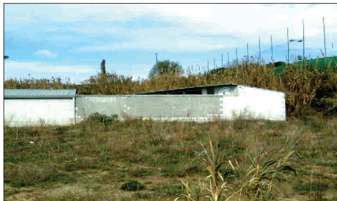
Zona on anirà el pati exterior

metàl·lica, de 12 m de fons per 10 m d'ample, que doni sortida a l'exterior a través d'una porta metàl·lica. L'objectiu és millorar la qualitat de vida dels animals.