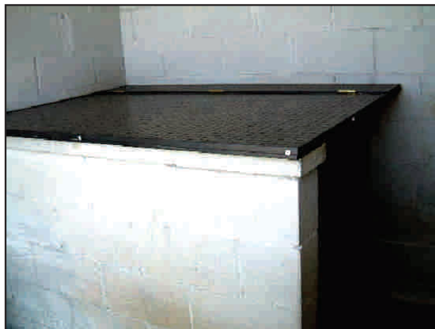
PROTOTIP DE CASETA

SI VOLEU COL·LABORAR-HI PODEU APADRINAR ELS GOSSOS DE LA GÀBIA, FINANCIANT EL COST DE LA CONFECCIÓ DE LA CASETA MÉS EL PALÉR. 150 €