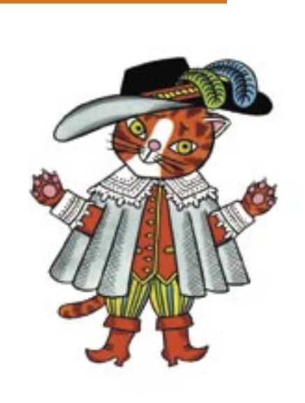
El gato con botas

Rudyard Kipling, que dio voz a tantos animales en "El libro de la selva", escribió